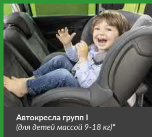
Автокресла групп I (для детей массой 9-18 кг)*