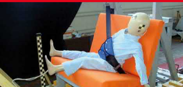
Результаты тестов использования небезопасных удерживающих устройств*

Дополнение определения «направляющая ляжка» в Правилах ЕЭК ООН № 44-04 было одобрено Всемирным Форумом (WP.29). Внесенная поправка к формулировке указывает на то, что «направляющая ляжка» рассматривается как составной элемент детской удерживающей системы и НЕ может отдельно официально утверждаться в качестве детской удерживающей системы в соответствии с настоящими Правилами». Это исключает даже формальную возможность сертификации устройств типа «направляющая ляжка»!