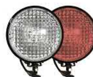
фары на СИМ